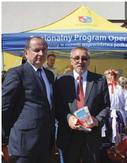
W Rumunii prezentowano także efekty wdrażania RPO na Podkarpaciu

Wrzesień wiąże się nie tylko z zakończeniem prac polowych, ale także z obchodzonym od wieków przez rolników świętem plonów. Ta piękna tradycja, która stała się częścią polskiej kultury jest także kultywowana przez Polonię za granicą.