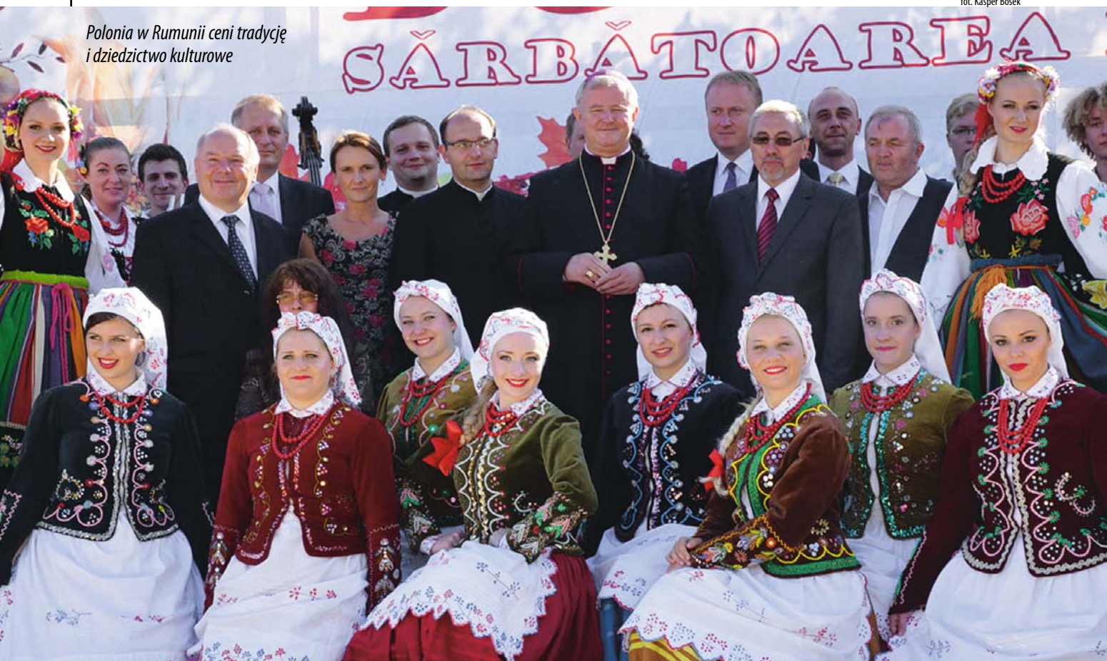
Polonia w Rumunii ceni tradycję i dziedzictwo kulturowe