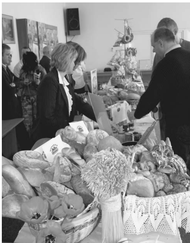
Swoje produkty prezentowało siedmiu wystawców.

Drugi etap konkursu odbędzie się w czerwcu. Kapituła ogólnopolska wyłoni wówczas laureatów konkursu spośród firm zgłoszonych z