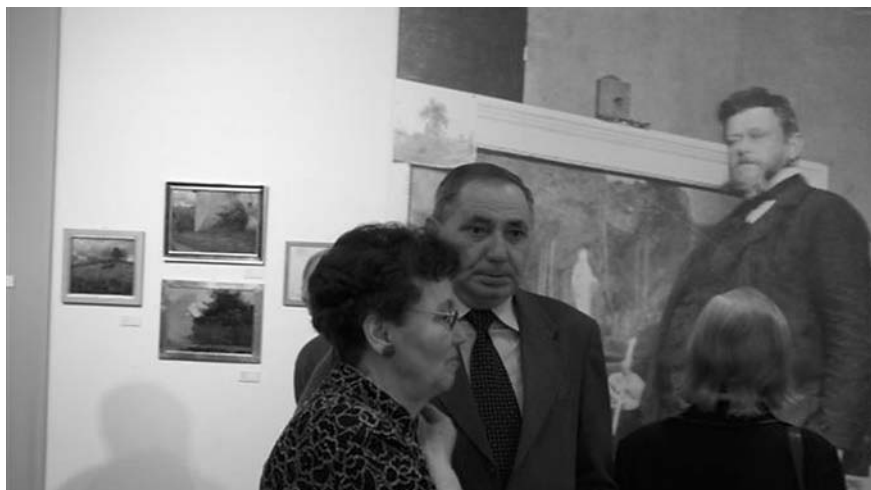
Fragment ekspozycji „Topole nad wodą” z sylwetką Jana Stanisławskiego. Tę wyjątkową ekspozycję, przygotowaną we współpracy z Muzeum Narodowym w Krakowie, które posiada najbogatszą kolekcję prac artysty, można obejrzeć do końca maja w Muzeum Okręgowym w Rzeszowie.

Województwo podkarpackie, z racji swego położenia na pograniczu politycznym, etnicznym i religijnym, należy do najbardziej zróżnicowanych pod względem kulturowym regionów naszego kraju. Bogate dziedzictwo kulturowe oraz prężna działalność wielu organizacji, jak i mieszkańców Podkarpacia, decydują o aktywności samorządu województwa w dziedzinie szeroko pojmowanej kultury.