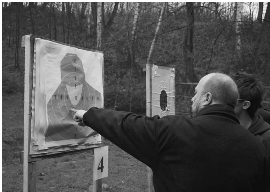
Tym razem tylko dziewiątka...

W klasyfikacji drużynowej zawodów zwyciężył zespół Gazety Codziennej Nowiny. Miejsce drugie przypadło repre-