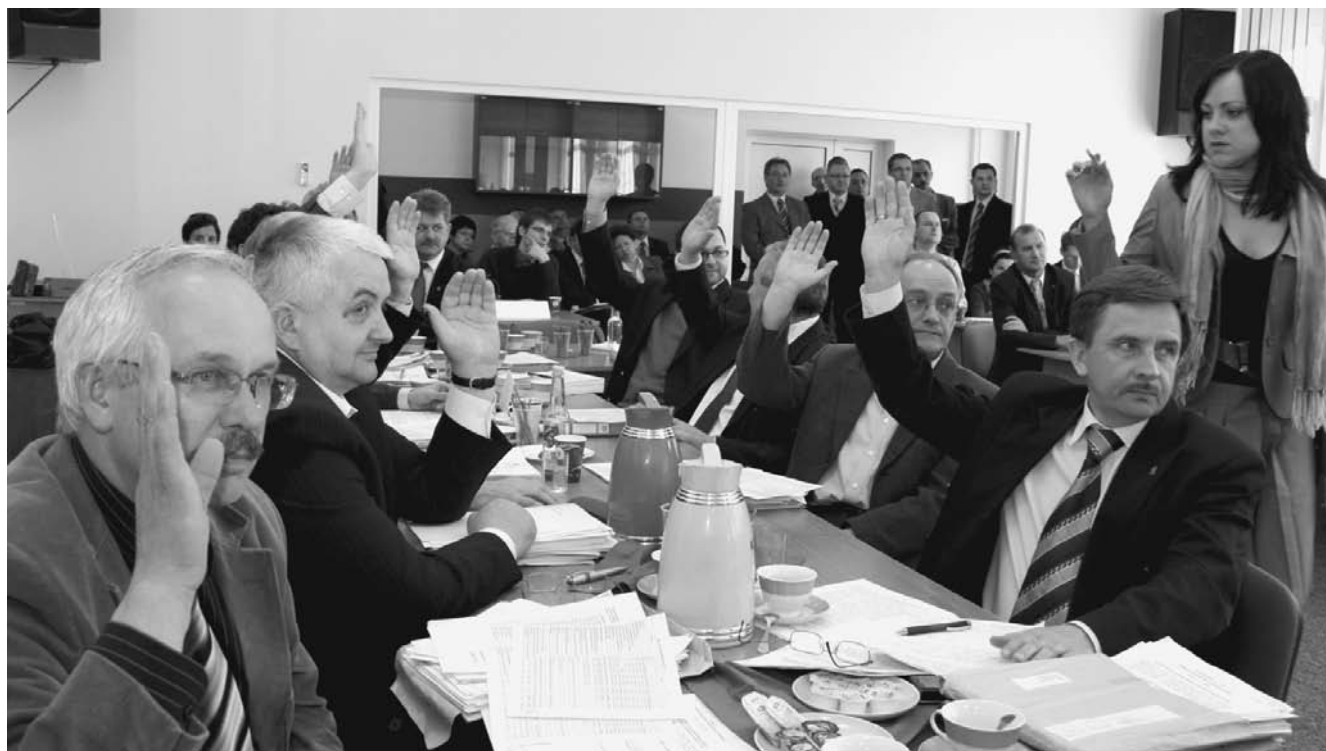
18 radnych opowiedziało się za udzieleniem absolutorium zarządowi województwa.

W dalszej części obrad radni przyjęli „Program Rozwoju Bazy Sportowej Województwa Podkarpackiego na rok 2008” oraz podjęli uchwałę w sprawie udzielenia pomocy finansowej z budżetu województwa podkarpackiego jednostkom samorządu terytorialnego na realizację w 2008 r. programu „Moje boisko - Orlik 2012”. Program Ministerstwa Sportu i Turystyki polega na budowie kompleksów sportowych umożliwiających uprawianie różnych dyscyplin sportowych na bezpiecznych, nowoczesnych boiskach sportowych. Wstępny koszt budowy jednego kompleksu sportowego określono na 1 mln zł. Na kwotę tę składać się mają w równych częściach środki z minister-