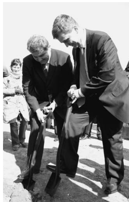
Pierwszy sztych pod przyszłą fabrykę Borg Warner.

W połowie kwietnia, również na terenie Podkarpackiego Parku Naukowo-Technologicznego „Aeropolis”, realizację