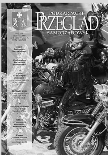
Okładka: Rozpoczęcie sezonu motocyklowego, czyt. s. 10