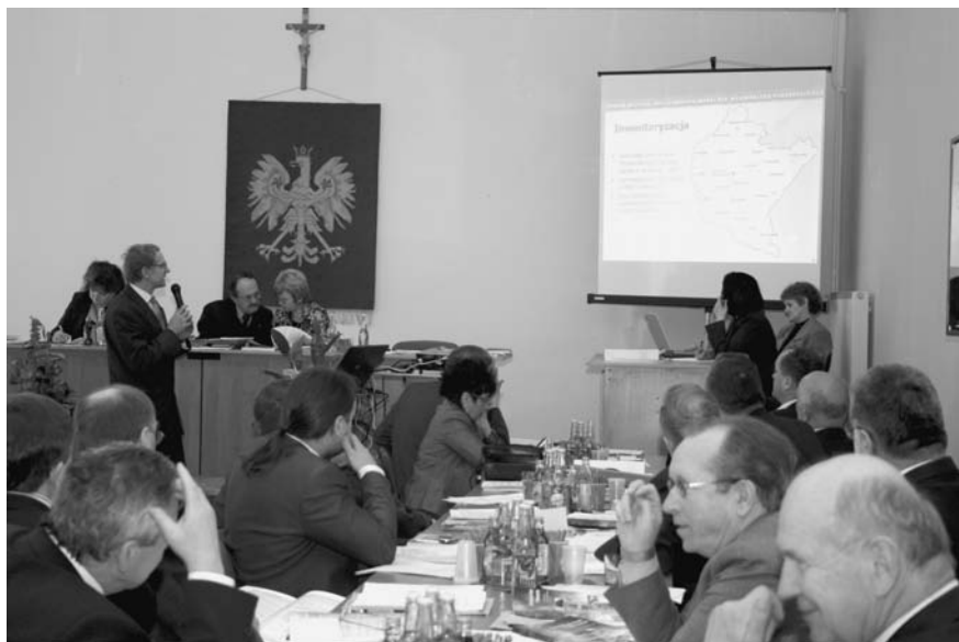
Podczas sesji radnym zaprezentowana została Strategia Informatyzacji Województwa Podkarpackiego na lata 2007-2013.

na lata 2007-2013 w województwie podkarpackim. W trakcie obrad przedłożone zostały także informacje dotyczące: stanu wdrażania Inicjatywy INTERREG oraz programów współpracy transgranicznej, transnarodowej i międzyregionalnej 2007-2013 w województwie podkarpackim; stanu zabezpieczenia przeciwpowodziowego na terenie województwa; realizacji planu finansowego terenowego Funduszu Ochrony Gruntów Rolnych; złożonych wniosków i środków pozyskanych oraz zrealizowanych zadań przez instytucje kultury w ramach programu Ministerstwa Kultury i Dziedzictwa Narodowego „Mecenat – 2008”; o sytuacji na rynku pracy w 2007 r.; o działalności Samorządowych Kolegiów Odwoławczych w Rze-